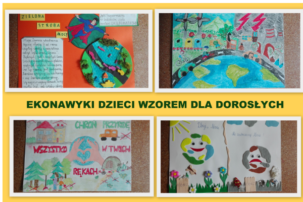
EKONAWYKI DZIECI WZOREM DLA DOROSŁYCH

Śmieci swoje miejsca mają, W pojemniki się chowają. Zieleń to oznacza szkło, Żółty plastik, brąz to bio. Papier wrzuc do niebieskiego, cała resztę do czarnego. Segregując śmieci tak Dbasz by piękny był nasz świat!