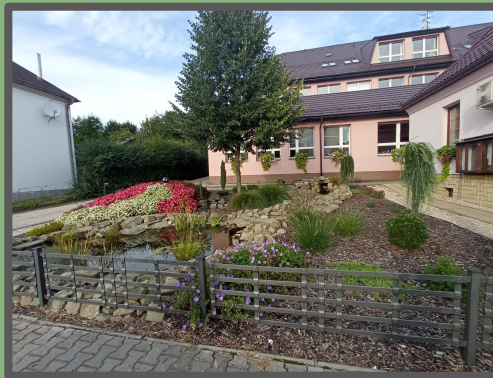
jezírko u obecního úřadu