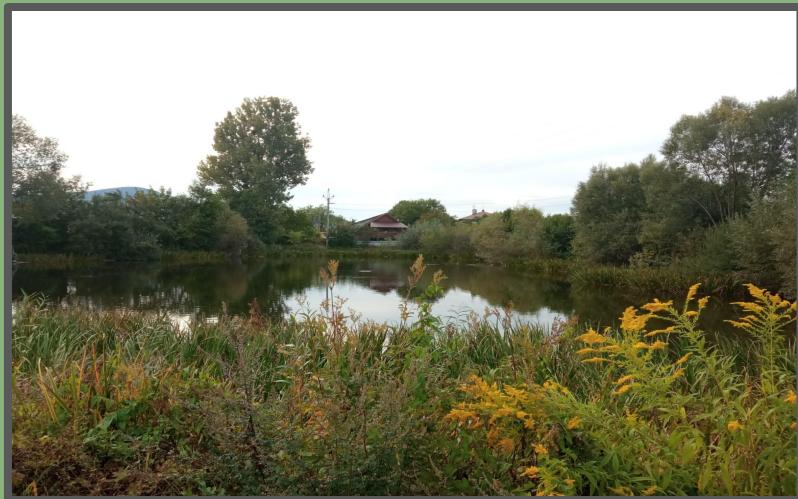
rybník u stavebnin