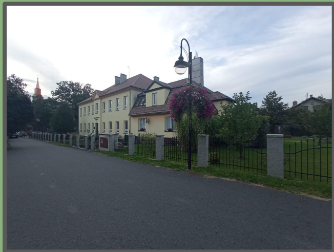
Polská základní škola