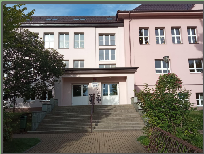
vchod do Masarykové ZŠ Návsí