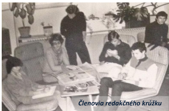
Členovia redakčného krúžku

Pátraním v kronikách sme zistili, že náš Vareškár mal svojho predchodcu. Bol ním školský časopis GASTRONÓM a zachovalo sa len jedno číslo.