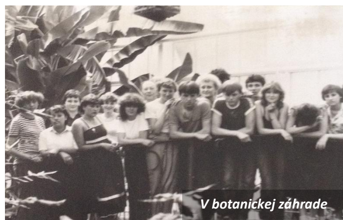
V botanickej záhrade